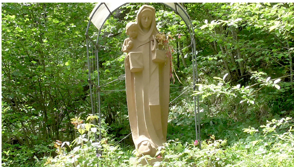
Die »Irlmaier-Madonna«, an einem für Menschen besonders positiven Kraftort errichtet.