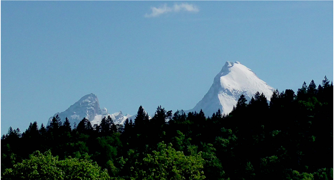
Foto: Der Watzmann vom Untersberg aus gesehen