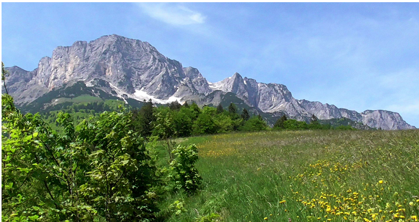
Der Untersberg von Südosten her gesehen - von einem Ort hoher Anomalie aus