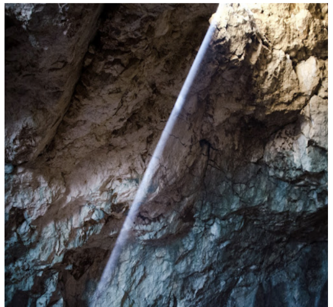
Lichtstrahl in einer Höhle auf dem Untersberg

Passende Ernährung, frisches Wasser, Sonne und Licht, möglichst ursprüngliche Natur und besonders Orte, an denen wir viel positive (rechtsdrehende) feinstoffliche Energie aufnehmen können, stellen Quellen für das jetzt Nötige dar. So können wir energiearme, depressive und unentschlossene Zustände vermeiden bzw. verringern.